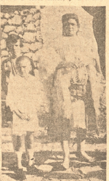
Una mujer de Castelrosso en traje del país

Todos los habitantes viven en una sola aldea y Castelrosso presenta el aspecto de un centro con casas adosadas la una a la otra, que se agrupan alrededor de la profunda ensenada del puerto, cerca del cual se encuentran las numerosas tiendas, provistas de toda clase de mercaderías y parecidas a pequeñas bazares. Los barrios periféricos están dispuestos en pendientes y las casas están separadas por callejuelas escarpadas, bien empedradas, dada la abundancia de piedra que sirve a tales fines, y a menu-