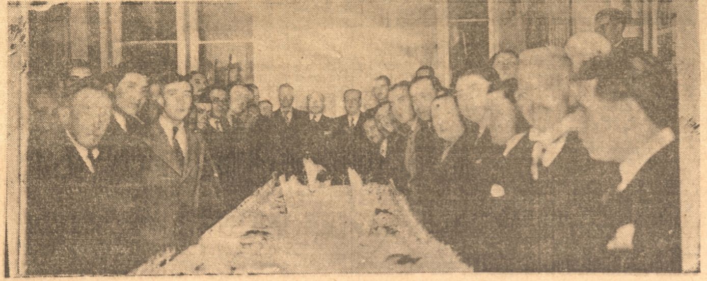
GRUPO DE ASISTENTES A LA MANIFESTACION