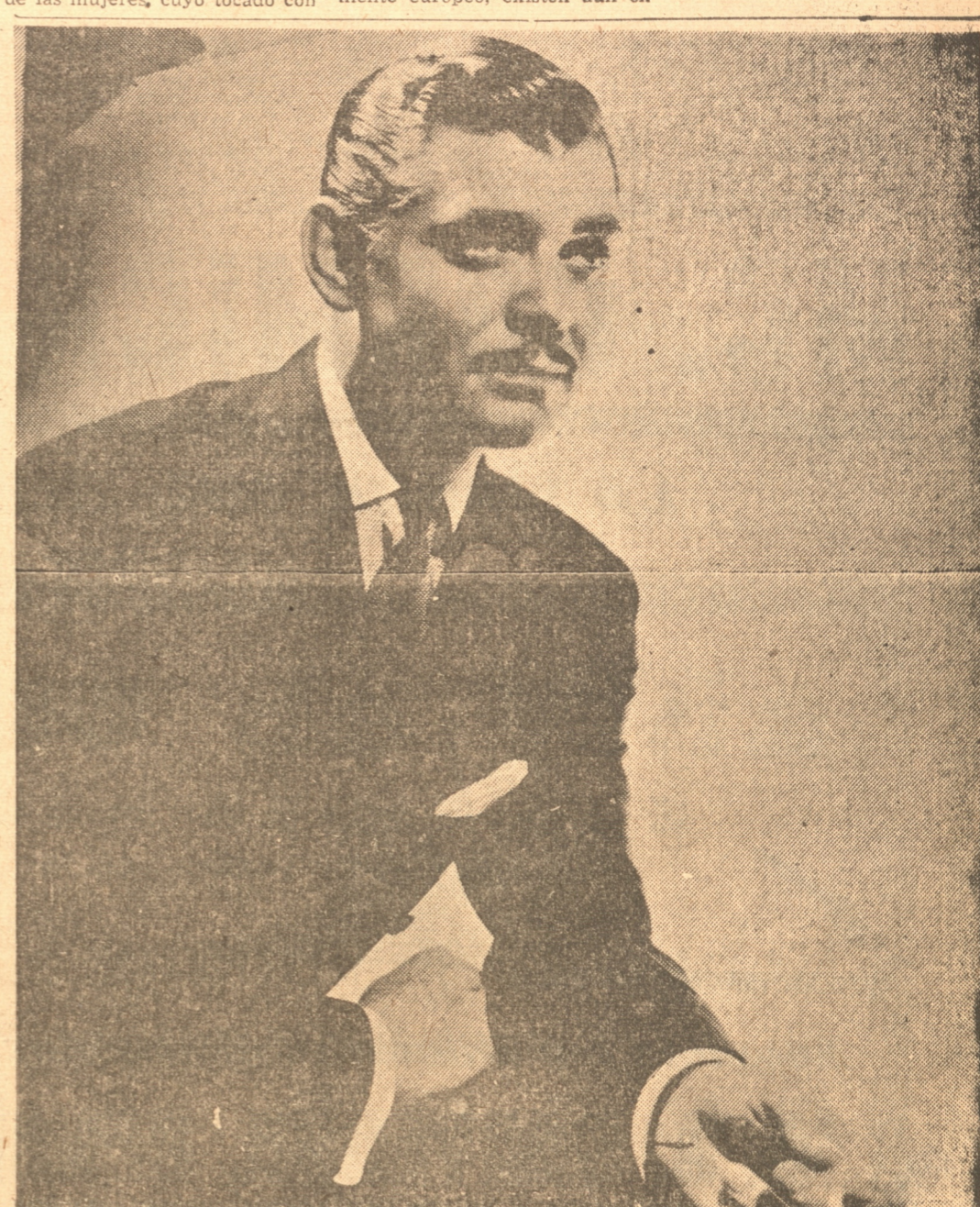
CLARK GABLE, el popular actor de la Metro-Goldwyn-Mayer