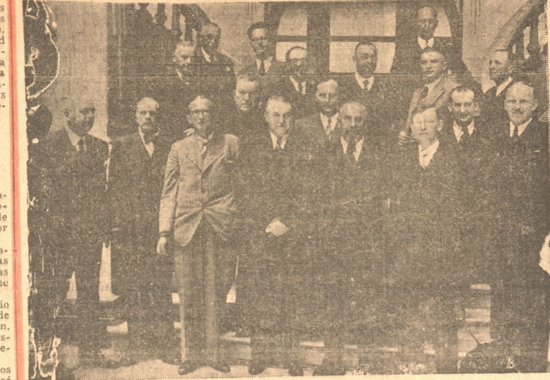
ASISTENTES AL ALMUERZO QUE LA LIGA GERMANO CHILENA OFRECIO A LOS PROFESORES ALEMANES EN EL CLUB CONCEPCION.

El día de hoy está destinado al descanso de los profesores, pues el viaje a la isla Quiriquina que se había programado no fué posible realizarlo por diversos motivos. Mañana terminan sus labores de difusión científica en nuestra ciudad con sus conferencias de clausura, a las cuales, como las anteriores se desarrollarán en el Pabellón de Anatomía Patológica, Clínic y Universitaria.