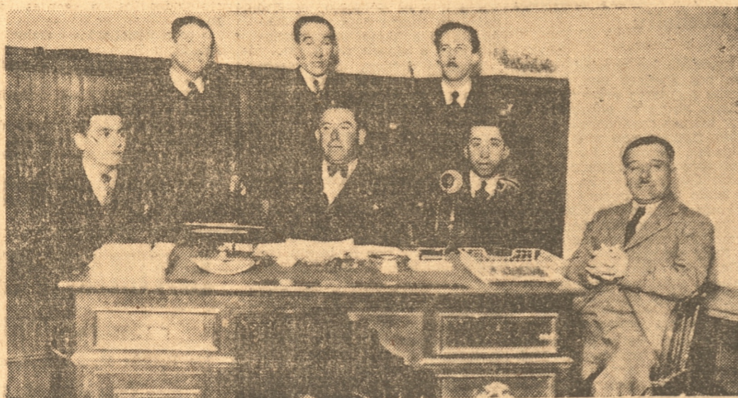
ACTUAL DIRECTORIO DEL PALACIO

DETALLES DEL CAMINO A LIRQUEN. — OTRO CAMINO QUE MERECE ATENCIÓN. — NUEVO CAPITAN CAMISARIO. — NOTICIAS DE INTERES