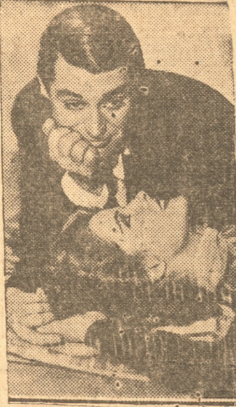
GARY GRANT y KATHERINE HEPBURN en "Vivir para gozar"