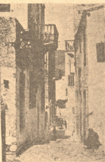
Una calle de Castelrosso. Nótese los balcones y el aspecto típico de las casas

Los calcáreos, que existen en la mitad septentrional de la isla, pertenecen al Cretáceo superior y son muy compactos en la parte meridional resultan más resacas (Eseno medio) y algo más removidos; por doquier se muestran llenos de hendiduras, dando lugar a con cavidades cársicas, pozos absorbentes, valles ciegos y gru-