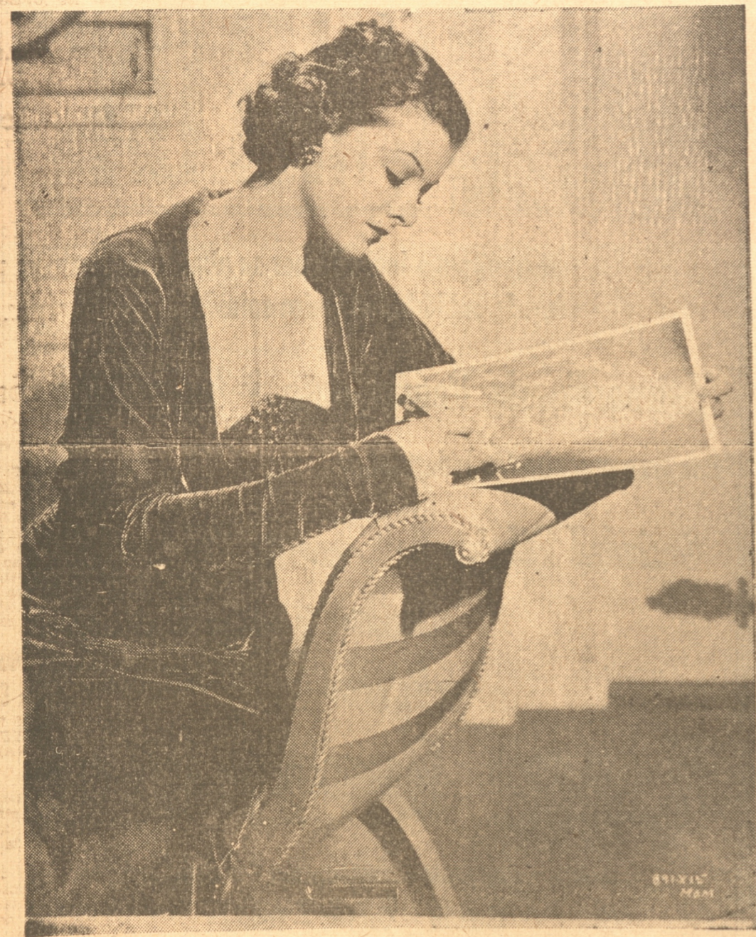
MYRNA LOY, estrella de la Metro-Goldwyn-Mayer, firmando fotografías para sus amigos

En todas las aldeas son numerosas las fiestas tradicionales. Las más curiosas y características son la que tienen lugar en ocasión de los esponsales, que duran varios días y en las cuales participa generalmente toda la aldea.