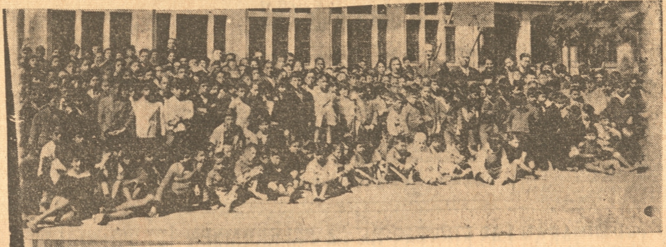
Un aspecto del acto que se desarrolló en la escuela Bulnes