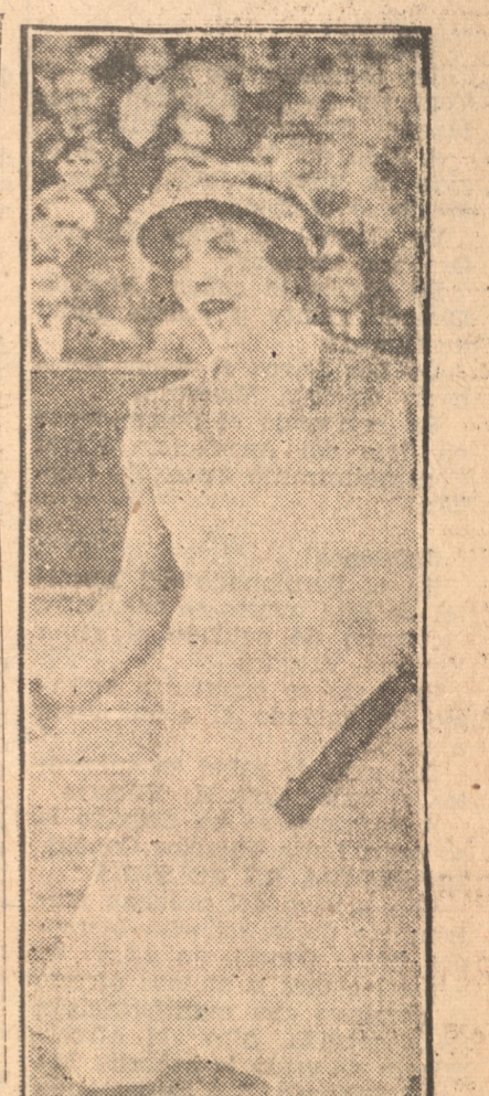
HELEN WILLS, la gran tenista de fama mundial

Comunicaciones llegadas de Nueva York aseguran que la tenista de fama mundial Miss Helen Moody Wills ha sido invitada a Sudamerica por la Asociación Argentina de Tennis. La reciente vencedora de Wimbledon y por ende considerada la mejor raqueta femenina mundial de tennis estaría dispuesta a realizar una gira por sudamerica formando en compañía de varios buenos jugadores europeos que también han sido invitados a actuar en Buenos Aires. El anuncio de la jira de Miss Moody, mejormente conocida como Helen Wills en los círculos del tennis mundial, ha despertado un interés poco común y se sabe que la Federación Chilena haría gestiones activas para que la celebrada jugadora actuara en los courts de la capital. La rival indicada de Miss Wills para sus matches en Chile sería indudablemente Anita Lizana, la jugadora que ya viene de regreso de su triunfal jira por los courts de Europa y que se ha consagrado como una de las mejores jugadoras del mundo por su campaña realizada. La jira de Miss Wills y de sus ases del tennis mundial como el Baron Von Cram y otros se realizaría en el mes de febrero y el cable termina asegurando que sólo falta ultimar algunos puntos relacionados con la financiación de los gastos de viaje de la gran jugadora y acompañantes de parte de las Federaciones de Tennis de Sudamerica. Informaremos sus ediciones próximas sobre el particular.