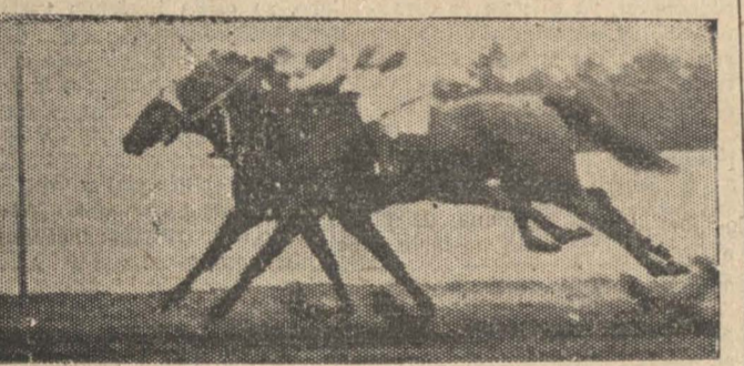
En la quinta carrera del 7 del presente. Gin Sower se impone sobre Visón, en estrecha llegada.