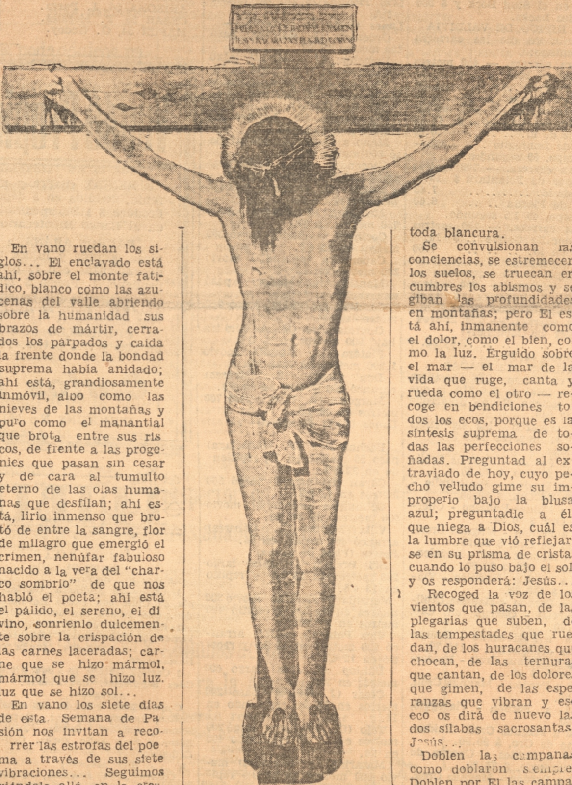
Cristo en la Cruz, de Velázquez que se conserva en el Museo del Prado