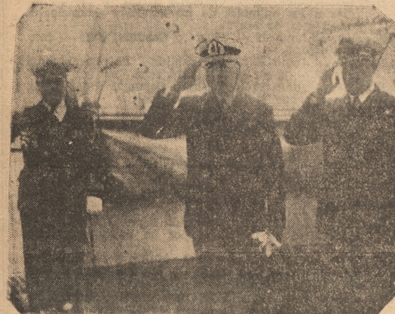
EL COMANDANTE EN JEFE DEL APOSTADERO LLEGA A BORDO

La travesía fué de 2.340 millas. Aunque la barra estaba sumamente mala llegó a bordo el señor sub-delegado marítimo. Momentos más tarde en diferentes embarcaciones llegaron también algunos nativos que subieron a bordo a saludar a sus antiguos conocidos de viajes anteriores, preguntando noticias del conti-