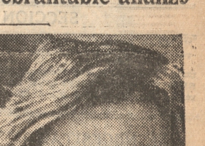
M. PIERRE LAVAL

Colaborarán en favor de la paz europea PARIS, 28.—(UP).— El nuevo Premier yugoslavo señor Stoyadimovitch envió un telegrama al Premier M. Pierre Laval expresándole la inquebrantable unión de Yugoslavia a Francia, como asimismo sus deseos de colaborar estrechamente en favor de la paz como objetivo común de ambos países. M. Laval le contestó en términos muy carnosos, agradeciendo su mensaje en el que le expresa que, unida profundamente por la amistad a Yugoslavia, Francia espera continuar en estrecha colaboración con su aliada en la tarea de acercamiento y reforzamiento de la paz europea.