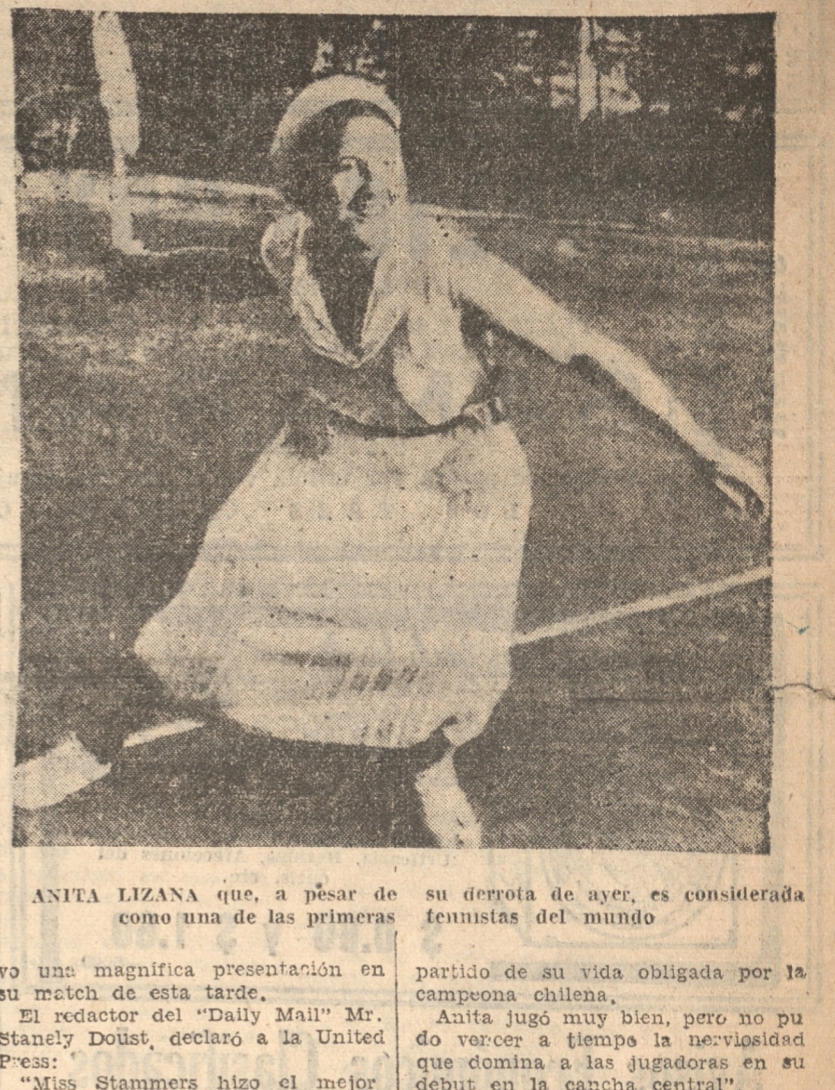
ANITA LIZANA que, a pesar de su derrota de ayer, es considerada como una de las primeras tennistas del mundo