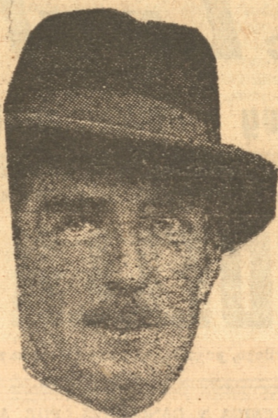
Canciller británico Mr. Eden, que encabeza la delegación británica a la Conferencia del Mediterráneo.