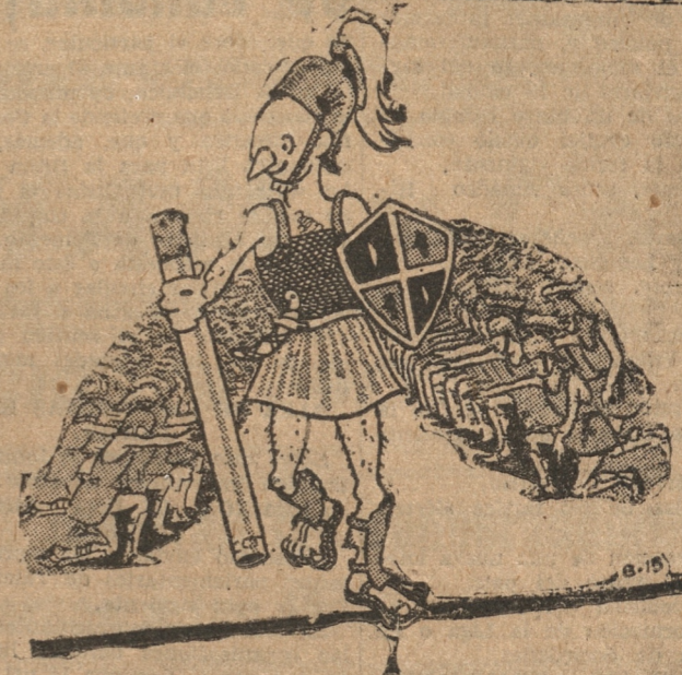
(Del "Romancero de Típo")

modificaciones a los artículos segundo y quinto, pero insistió en mantener la redacción dada al artículo 11, que trata de la exención de impuestos fiscales. También acordó mantener la redacción dada a los artículos 10 y 17, y la redacción de la disposición que establece que el precio de cada parcela no podrá ser superior a cincuenta mil pesos, incluyendo el valor de la casa habitación. Quedó pendiente la resolución sobre las demás modificaciones. INSTITUTO DE CREDITO INDUSTRIAL. — Se inició la discusión particular del proyecto que reorganiza el Instituto de Crédito Industrial, ensanchando su campo de acción en favor de las diversas industrias. Quedaron despachados los tres primeros artículos, y pendiente el cuarto.