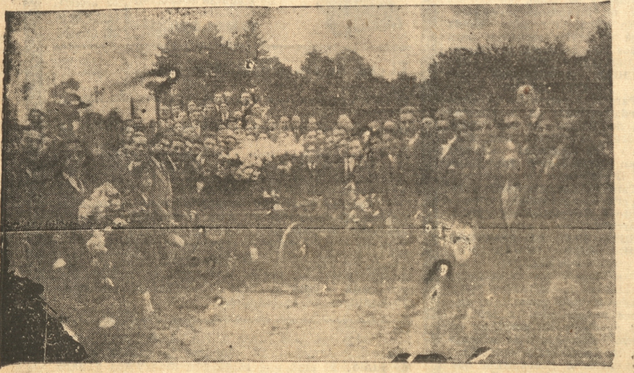
ASISTENTES A LOS FUNERALES DEL JOCKEY PEDRO OLGUIN

Asistieron miembros del directorio del Club Hípico, todo el gremio y nume- rosos amigos. — La lista de los asistentes