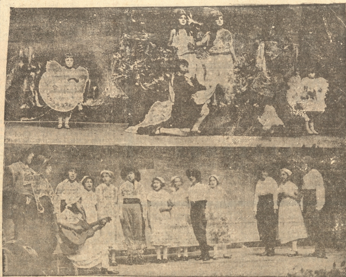
ALEGORIA, POR LOS CURSOS DEL III C. Y D. PERICON ARGENTINO POR EL III B.

Cuando su cabello o bigote se pone canoso, debe emplear La Tintura Instantánea Francois