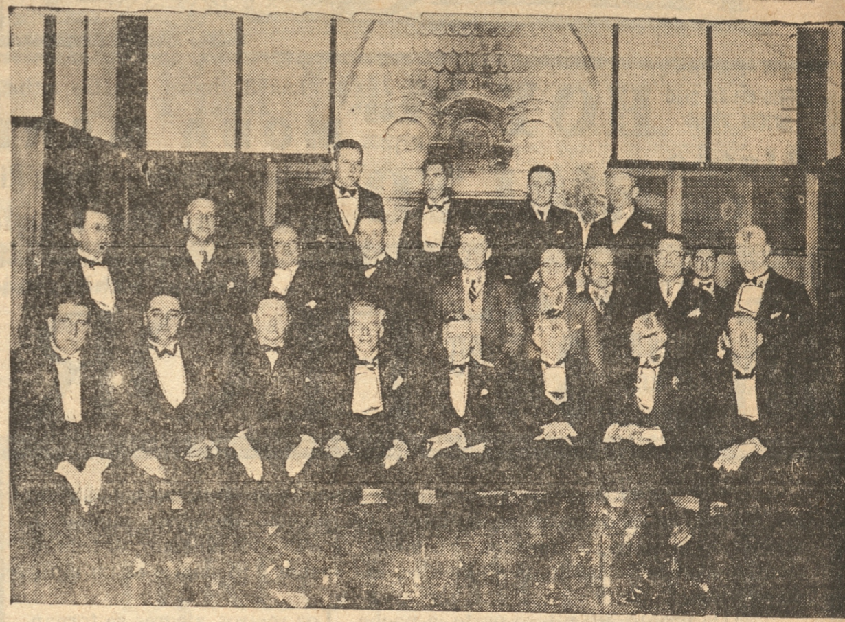
Asistentes a la manifestación ofrecida anteanoche en el Club