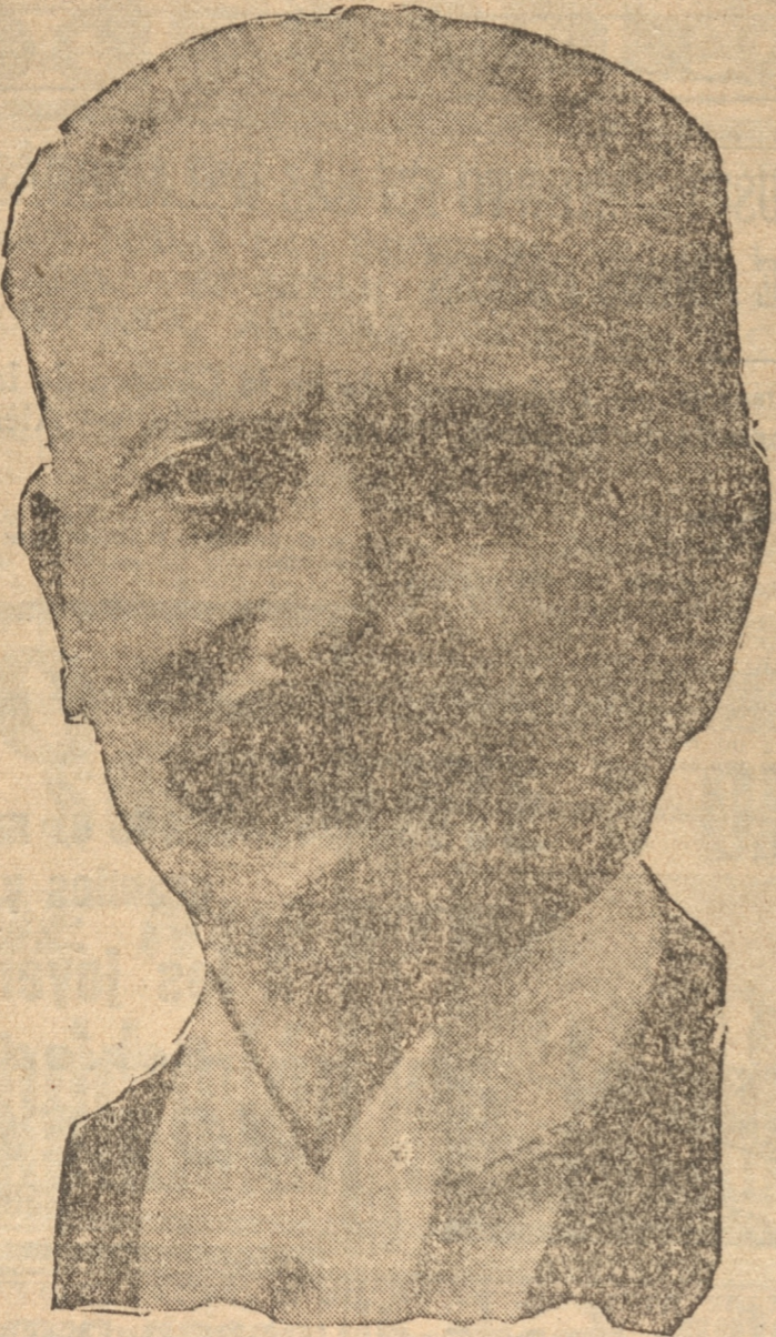
M. GASTON LEERON, PRESIDENTE DE FRANCIA

Minutos más tarde la tragedia estaba consumada. El dolor agobiado a un pueblo entero que hoy comparte los sufrimientos de veinte familias. De un pueblo que marchará mañana reverente detrás de los féretros de estas 21 víctimas inocentes de la desgracia de ayer. De un pueblo en cuyo duelo lo acompañan los sentimientos de todo el país, que ha sentido de cerca esta horrible desgracia. Inclínmonos ante el dolor de estas veinte madres y de toda una ciudad, y elevemos nuestras plegarias por el alma de las víctimas, del rápido drama de la tarde de ayer, cuya repercusión llegará, estamos seguros, a todos los corazones, uniéndolos al fondo pesar del pueblo de Talcahuano.