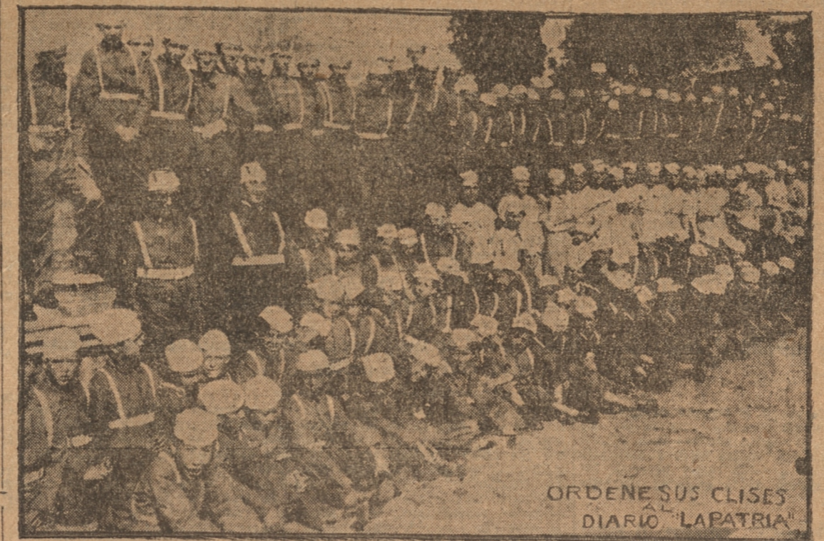
ORDENE SUS CLISES DIARIO "LA PATRIA"

Una simpática fiesta hubo ayer en el cuartel de la institución.— Se puso término al período de instrucción de este año de los cadetes