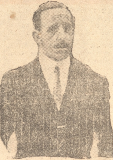
S. M. Alfonso XIII

MADRID, 15 (U. P.).— Un avión voló sobre la ciudad, descendiendo en un campo cercano a la ciudad; una cantidad de personas que se halla en las inmediaciones ac-