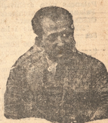
Comandante Ramón Franco

Madrid, 15 (U. P.).— El Embajador español en Lisboa avisó telefónicamente