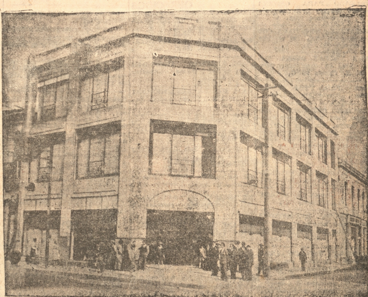
Hermosa fachada del nuevo edificio levantado en Colo-Colo con Barros Arana, donde la casa Gath y Chaves ha instalado las diferentes secciones