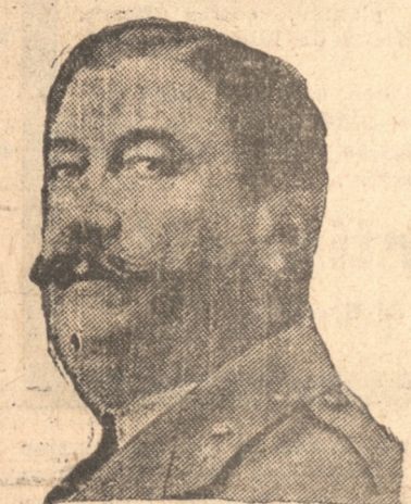
General Dámaso Berenguer

MADRID, 15 (U. P.).— La ley marcial se ha declarado en toda España. Todas las