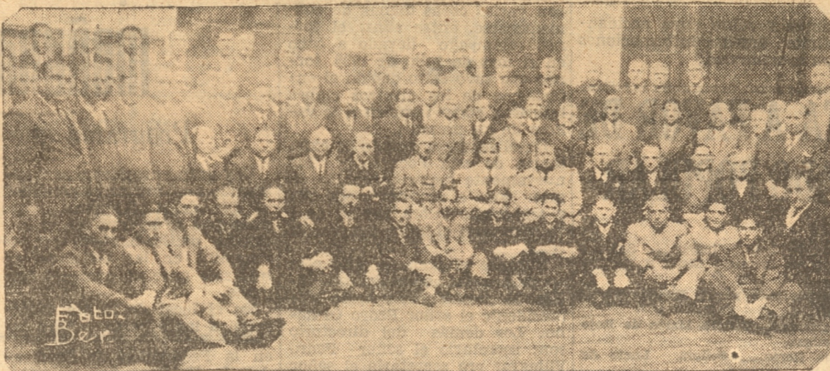
GRUPO GENERAL DE LOS ASISTENTES AL ALMUERZO DE AYER

Permítidme recordaros el compromiso que habéis adquirido en esta convención de realizar una intensa y constante labor de captación y convencimiento cerca de los colegas de nuestra respectiva provincia, que