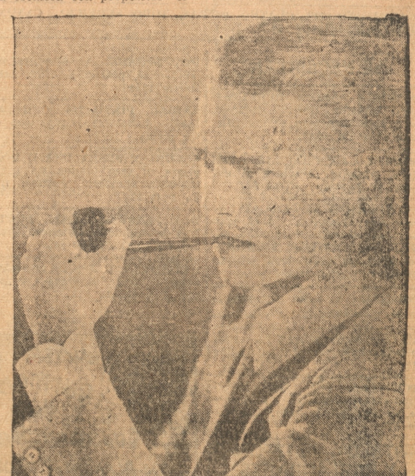
Douglas Fairbanks, Jr, como su padre se ha colocado entre los intérpretes más cotizados dentro y fuera de Cinelandia