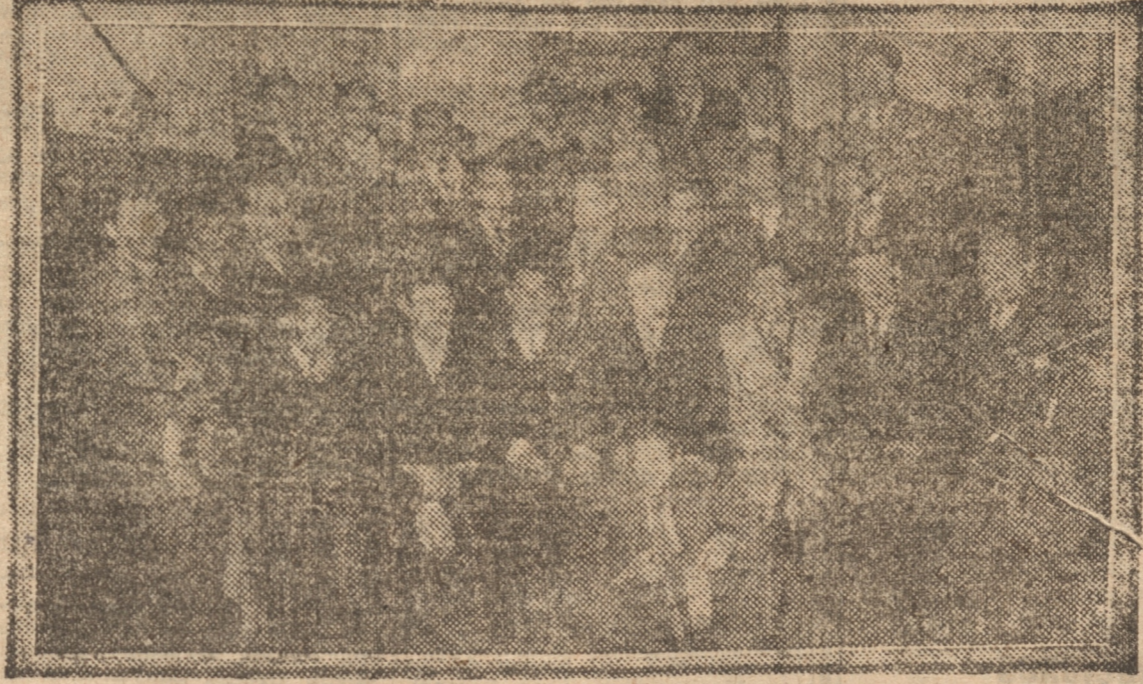
EN NUESTRA CASA

LLEGO AYER TARDE LA DELEGACION DEL AUDAX ITALIANO DE SANTIAGO. — MAÑANA SE MEDIRA CON EL COMBINADO PORTENO-PENQUISTA QUE FUE FORMADO ANOCHE. — LA RECEPCION A LOS VISITANTES. — LOS EQUIPOS QUE JUGARAN. — OTROS DATOS INTERESANTES. — EL REFEREE LLEGARA HOY. — VISITA A "LA PATRIA" DE DELEGADOS DEL AUDAX