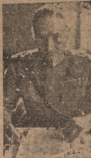
COMANDE EN JEFE del ejército de Finlandia, teniente general, Hugo Osterma.

GRAZ (ESTERIA) 11 (UP) — Se anuncia que el individuo que mató a los aduaneros alemanes de Sulmbach en la frontera con Yugoslavia fué muerto a tiros por la policía, después de haber matado al tercer aduanero. El hombre era un joven de 22 años que fué acorralado en un granero y liquidado después de una tremenda lucha.