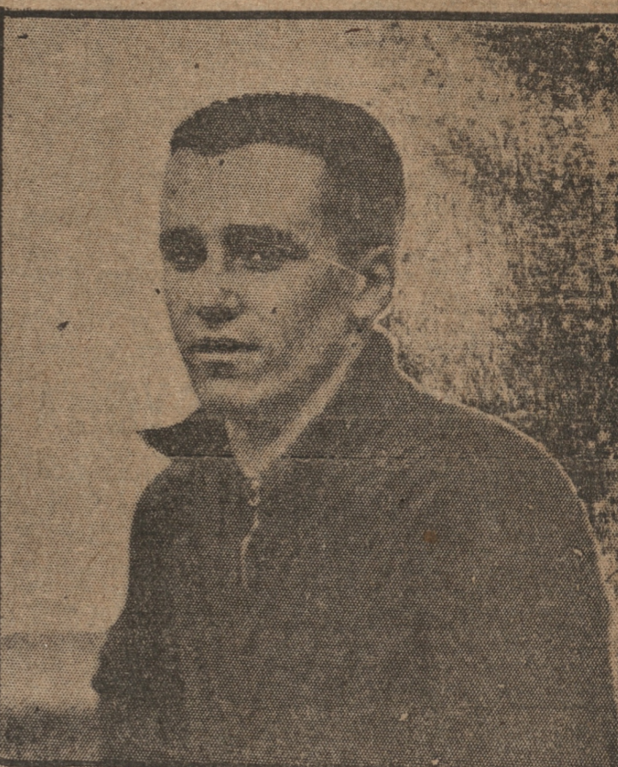
BESSUZO El notable arquero de River Plate de Buenos Aires