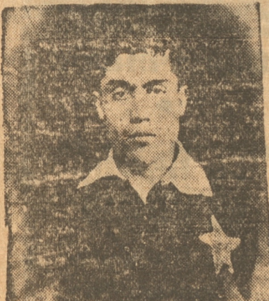
ARAVENA DE LOTA

Este lance se jugará en la cancha 1 de la Av. Collao