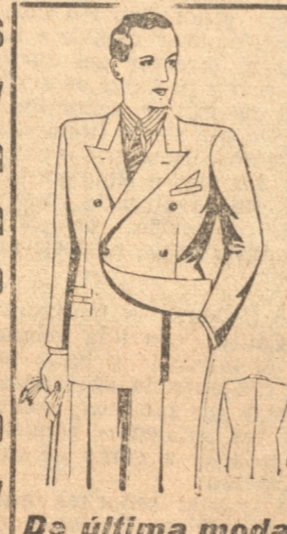
Pasano de moda

Podemos transformarles sus trajes y abrigos a la moda con poco dinero.