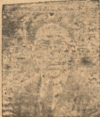
VASQUEZ DEL INDUSTRIAL

Industrial: La delegación visitante arribará a esta ciudad por el tren a las 13.50 horas, para cuyo objeto el Industrial