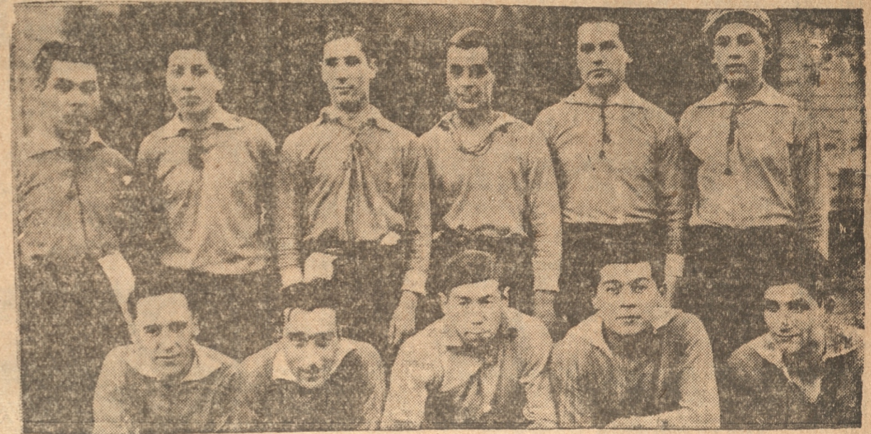
EQUIPOS DE "LA PATRIA" (arriba) y WILLIAMSON - FERROCOFER (abajo) QUE JUGARON EN LA COMPETENCIA DE AYER DE LA LIGA COMERCIAL DE DEPORTES

Ante una regular concurrencia se realizaron ayer en la cancha 1 de la Av. Collao los matches de inauguración de temporada, que había organizado la Liga Comercial de Deportes entre sus equipos.