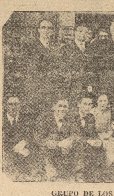
GRUPO DE LOS ASISTENTES A LA MANIFESTACION DE AYER

Respecto de nuestros negocios, que he perfeccionado todos nuestros actuales elementos de venta y de distribución (Vendedores, Depósitos, Bodega, Centro de Cuentas, etc.), he permitido que se les permita seguir trabajando en el país.