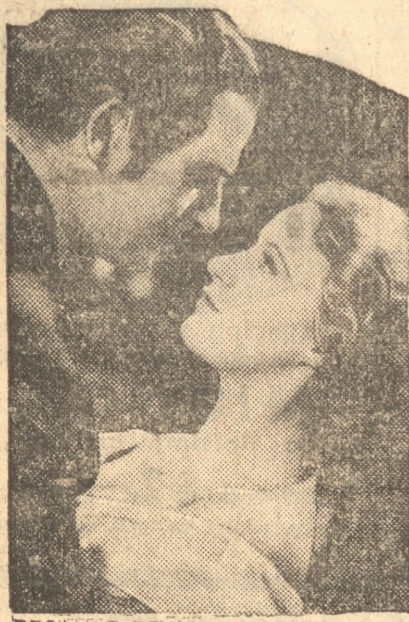
REGINALD DENNY and GRACE MOORE in "A LADY'S MORALS"