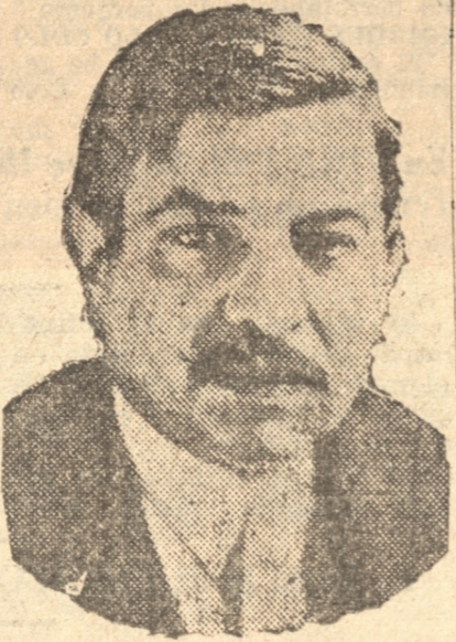
M. LOUIS LAVAL, PREMIER DE FRANCIA

"Ustedes saben llevar a la práctica los sentimientos de solidaridad, como ya muchas