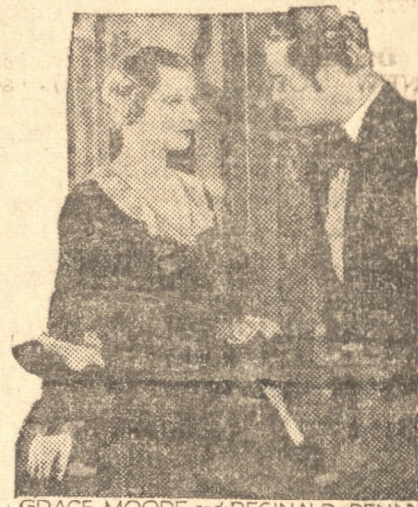
GRACE MOORE and REGINALD DENNY "A LADY'S MORALS"

Además oiremos: "ES EL DESTINO", "BARCAROLA", "CANCION ITALIANA" y CORO ESTUDIANTIL DE STRAUSS.