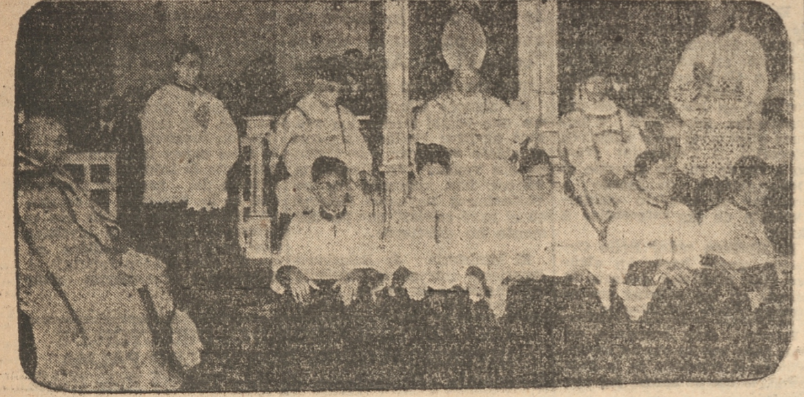
EL EXCMO. SR. OBISPO DE RANCAGUA MONS. DR. LIRA INFANTE PONTIFICANDO EN EL TEMPLO DE SANTO DOMINGO

A las 18.30 GRANDIOSA ASAMBLEA FINAL DEL CONGRESO, en el Teatro Concepción, cuyo programa publicaremos mañana. Presidirá el Excmo. señor Nuncio de su ciudad, las autoridades de la Provincia y los Excmos. señores obispos.