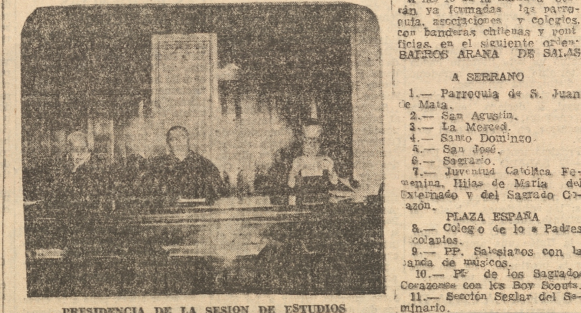
PRESIDENCIA DE LA SESION DE ESTUDIOS