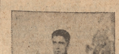
AGUILERA DE SCHWAGER

Un diario de Valparaíso informa que clubes de allí contarán en breves días en las olimpiadas.