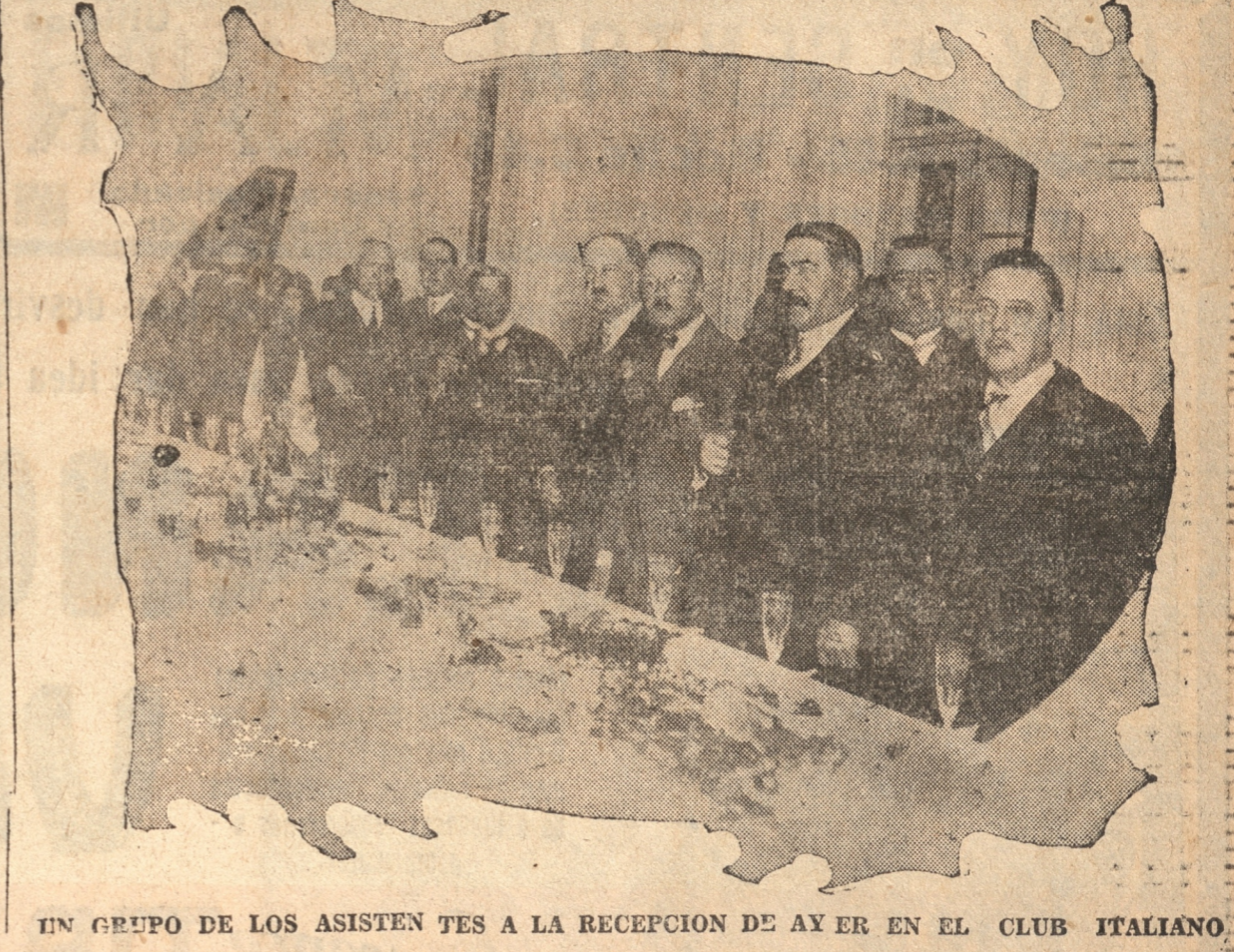
UN GRUPO DE LOS ASISTENTES A LA RECEPCION DE AYER EN EL CLUB ITALIANO.

LA RECEPCION DE AYER EN LOS SALONES DEL CLUB ITALIANO EN HOMENAJE AL DIA DEL REY VICTOR MANUEL III