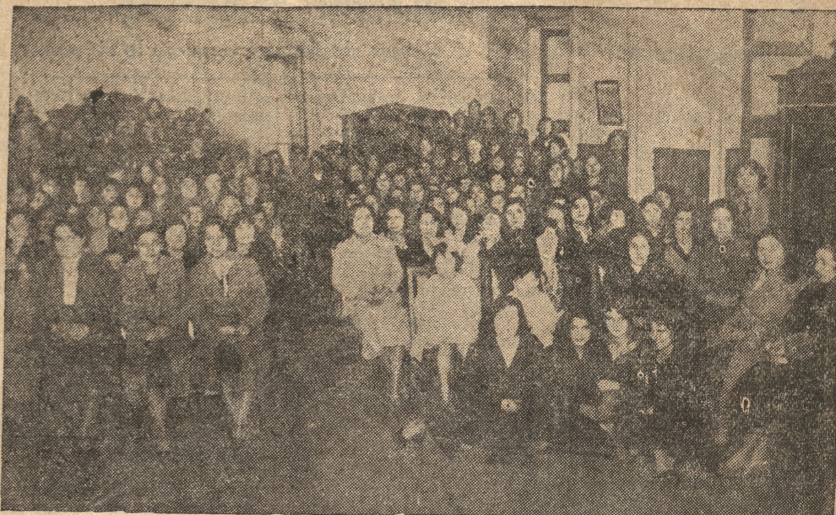
VISTA GENERAL DE LOS ASISTENTES A LA CELEBRACION DEL 31.º ANIVERSARIO DE LA ESCUELA TECNICA FEMENINA.

Ayer se efectuó una interesante velada en el salón de actos del establecimiento. — A las 10 horas de hoy, el profesorado y alumnas harán el reparto de obsequios a los cesantes