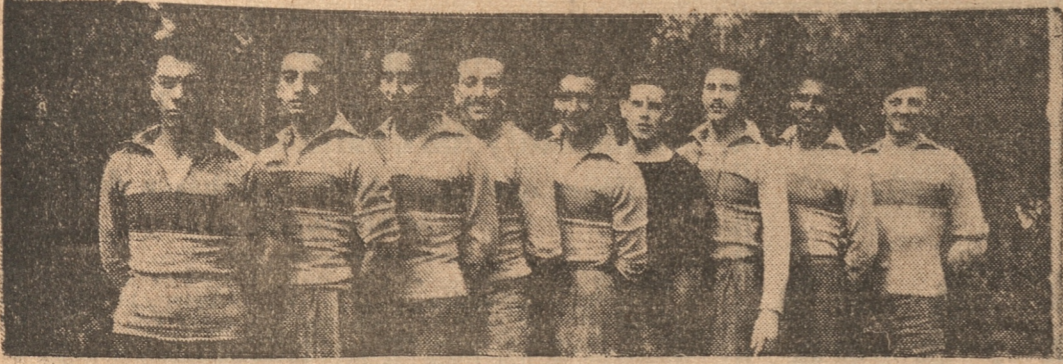
NUESTROS DEFENSORES EN EL CAMPEONATO NACIONAL DE BASKET-BALL

Los que van.— LA PATRIA estará representada en la gran competencia.— Hacemos breve comentario sobre nuestro five defensor.— Regresarán el martes próximo