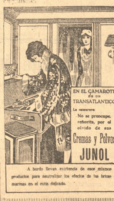
EN EL CAMAROTE TRANSATLANTICO No se preocupe, reanuda, por el olvido de sus Cremas y Polvos JUNOL