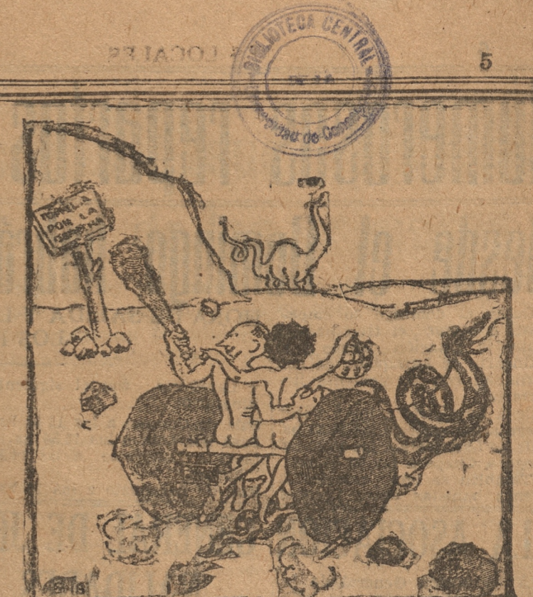
(De "El Romancero de Pipo")

Para los últimos días de la semana en curso se llevará a efecto en Valparaíso dos grandes fiestas de la Armada. La primera se realizará a las 5 de la tarde del día 28, en el Departamento de Navegación e Hidrografía ocasión en que será inaugurada la galería de honor de los primeros hidrografos chilenos. Asistirán a esta fiesta las altas autoridades navales y administrativas. Al día siguiente se efectuará, a las 13 horas, el acto de repartición de premios a los cadetes de la Escuela Naval. Es muy probable que a esta ceremonia asista el Presidente de la República, acompañado del ministro de Defensa Nacional.