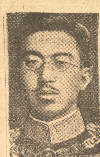
HIRO HITO, Emperador de Japon