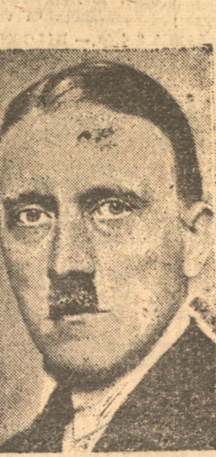
HITLER, el jefe del Gobierno alemán, autor del pacto anti-comunista

La resistencia de los republicanos fué tenacísima y la batalla se convirtió en un furioso