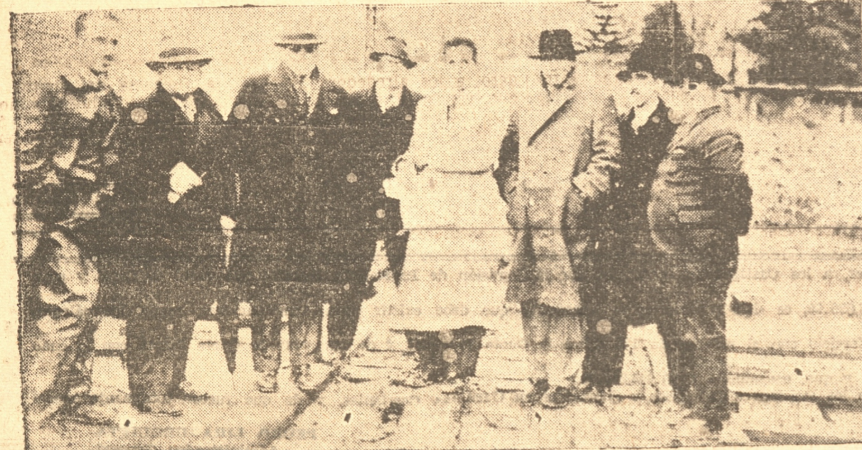
COMISION DE INGENIEROS QUE RECIBIO EL PUENTE NONGUEN Y ACOMPAÑANTES