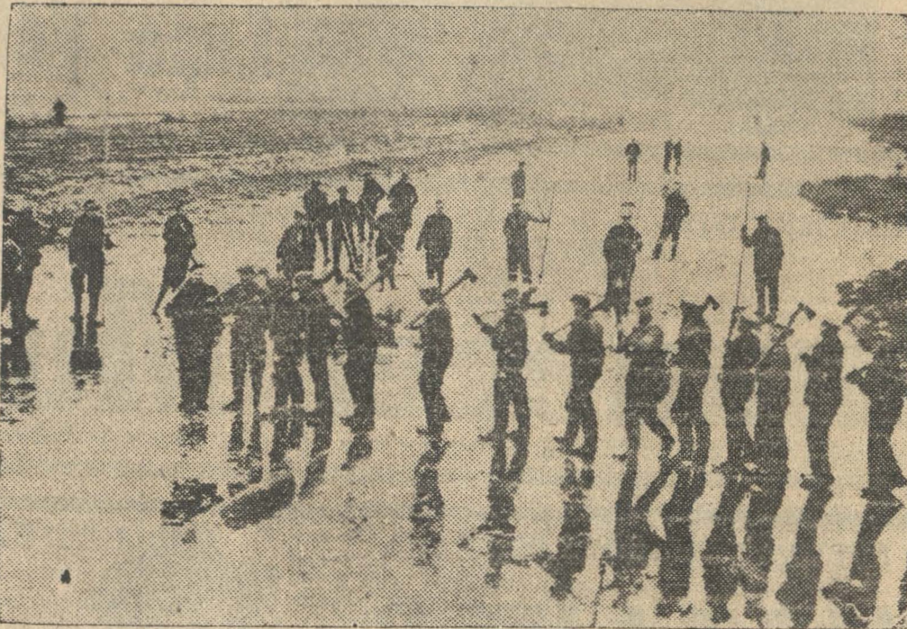
Un aspecto de Holanda, país donde los últimos acontecimientos de la guerra han sido mirados naturalmente con especial interés. El gobierno británico ha advertido a sus súbditos en ese país que estén preparados a abandonar el caso lo requiera.