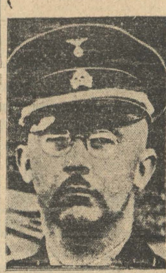
HIMMLER, el jefe de la Gestapo, quien se rumoreó había sido asesinado en Copenhague.

Berlín desmiente terminantemente la noticia