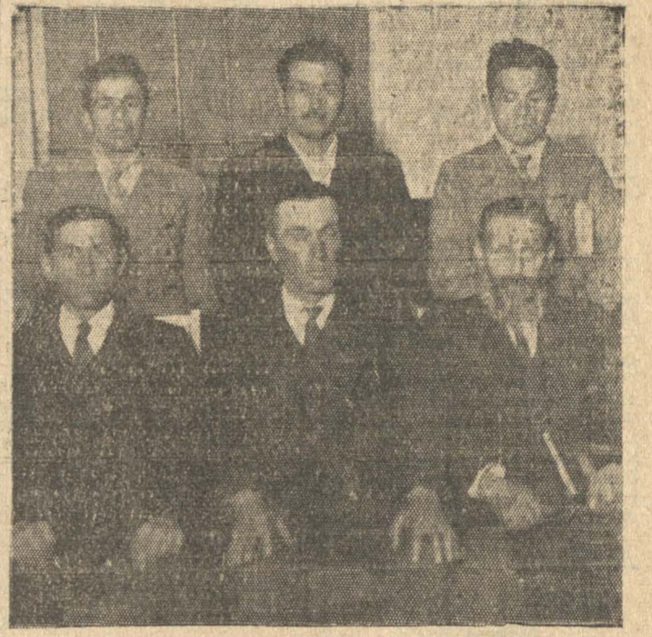
En la Unión Restauradora de Justicia Social como simple ciudadano, sin que exista presión alguna directa o indirectamente de parte del pastorado, pues como iglesias constituidas su actitud frente a los asuntos públicos es esencialmente apolítica.

Anteponeamos a nuestros derechos nuestros deberes ciudadanos en bien de todo gobierno legalmente constituido y de toda justa aspiración del pueblo. No somos terroristas ni revolucionarios, no somos exaltados ni