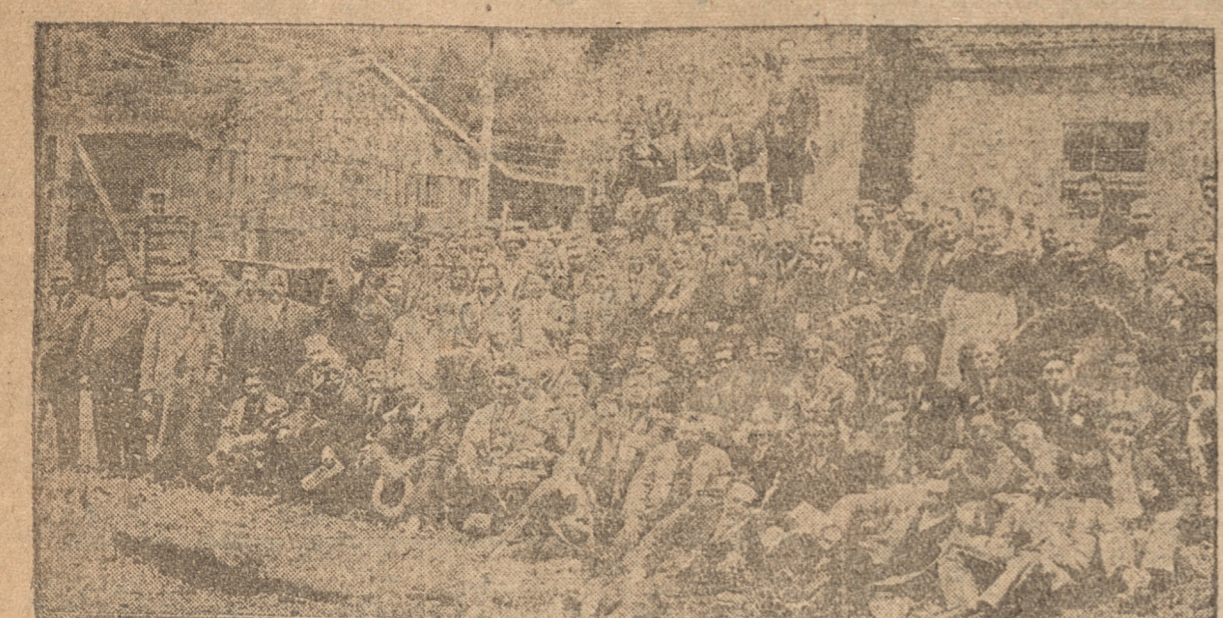
GRUPO GENERAL DE LOS ASISTENTES AL ALMUERZO EN TALCAHUANO.