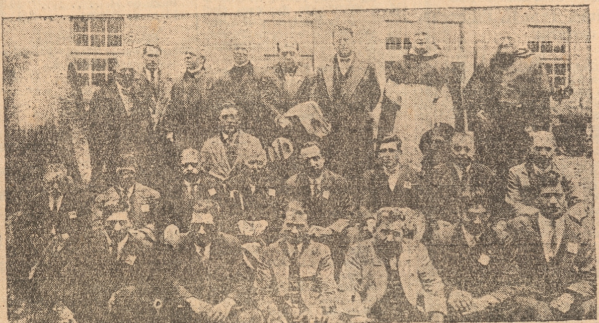
LAS DELEGACIONES DE FUERA POSAN PARA "LA PATRIA"