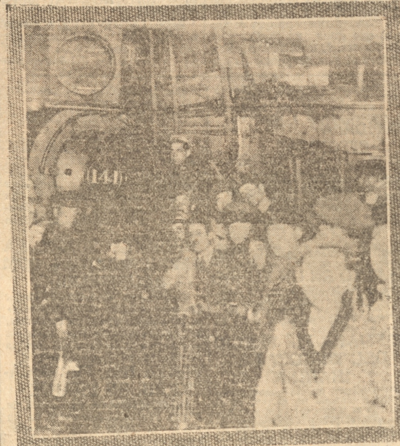
La locomotora y el tranvía en el lugar en que quedaron, después del choque

tusión en una pierna y una herida en la rótula derecha, el motorista Cavieles, quien, después de las primeras curaciones en la Asistencia Pública, fué llevado a su casa. La locomotora que causó el accidente, fué la número 141, que venía sola de Penco.