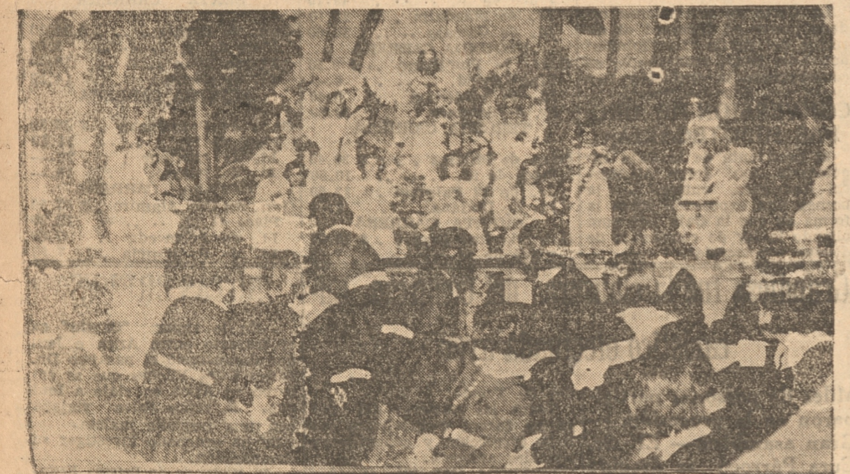
DURANTE LA ASAMBLEA EN EL SEMINARIO