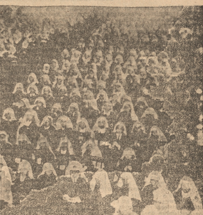
UNA VISTA DEL INTERIOR DE LA CATEDRAL DURANTE LA CEREMONIA