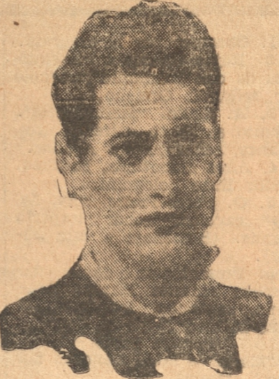
BOSSIO, el arquero argentino de gran fama

El goalkeeper argentino Angel Bossio, bien conocido en Chile, por su actuación en los campeonatos internacionales, autorizó al Club Boca Junior a que gestionase del Club Talleres, al que presta su concurso, la correspondiente transferencia.