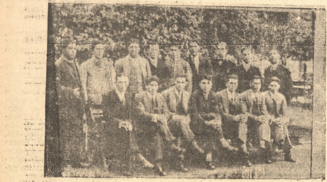
Delegación del Manuel Rodríguez de Lota que fué al sur en gira deportiva

Sección menores: El torneo interno de basketball comenzará muy luego, ciérrase a las inscripciones ya terminadas. Entre los chicos reina gran entusiasmo.