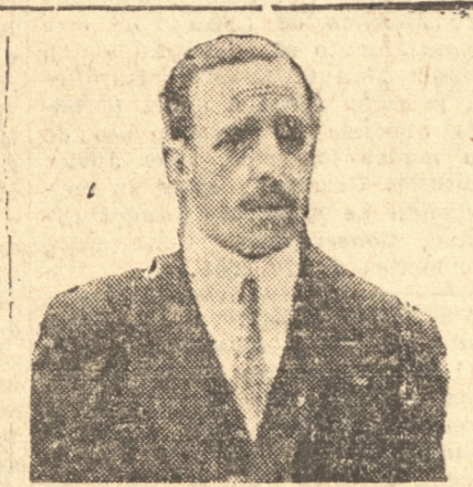
El ex-Rey ALFONSO XIII de España

MADRID, 20.— (UP).— Alas 3.40 de la madrugada de hoy, las Cortes aprobaron sin votación, la primera proposición de la Comisión de Responsabilidades, agregando el texto de la nueva proposición presentada por varios diputados y por la que se proscriba al ex-Rey don Alfonso XIII, se pide que la República confisque las propiedades del ex-Rey y que todo ciudadano quede autorizado para arrestarlo si el ex-Rey vuelve a España.