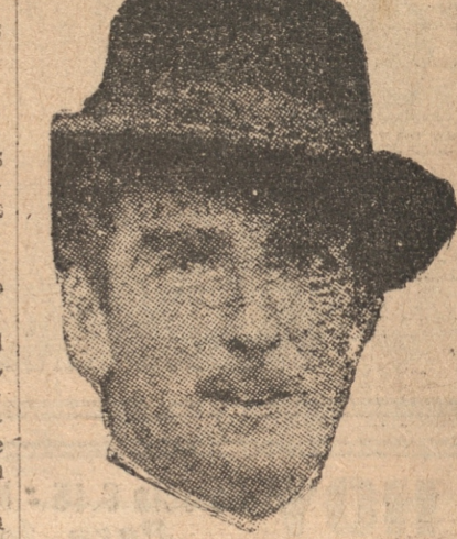
CAPTAN ANTHONY EDEN, que en el Consejo de la SDN, defendió el Pacto de la Liga