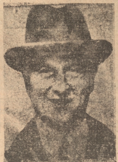
SIR SAMUEL HOARE, Canciller británico cuyo Gobierno marcha de acuerdo con el de Francia