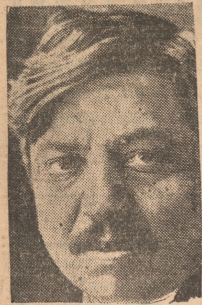
M. PIERRE LAVAL, representante de Francia ante la Liga de las Naciones, cuya política apoya

El Consejo suspendió sus labores a las 12.15 horas.