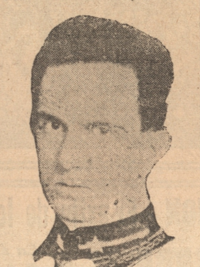
PRINCIPE HUMBERTO DE SA BOYA, heredero del trono italiano